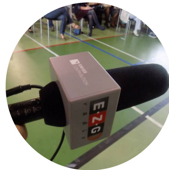
AUDYCJE RADIOWE (SZKOLNE)