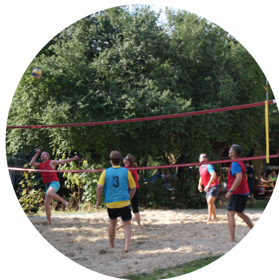
AKCJE I PROJEKTY STOWARZYSZENIA